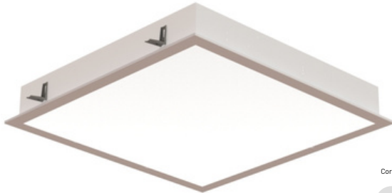
Imagem do produto